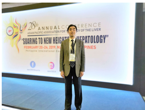
图1 本届年会的参会者。