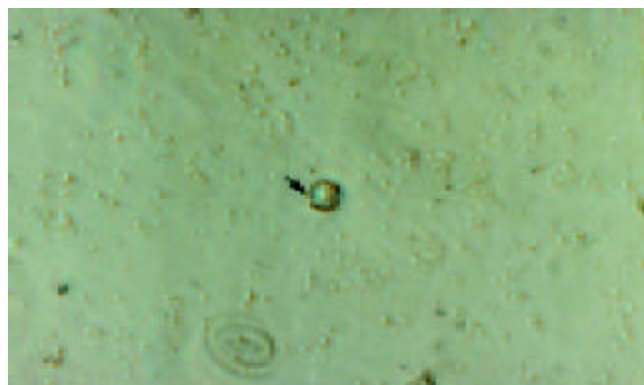
图1 外周血单个核细胞免疫组化. HCV NS3 抗原阳性, 棕黄色物定位于胞质×400.

应用免疫组化法检测 PBMC 中 HCVNS3 20 例阳性 7 例. 阳性产物成棕黄色, 细颗粒状, 不均匀或呈弥漫分布定位于胞质和胞膜(图 1、2).