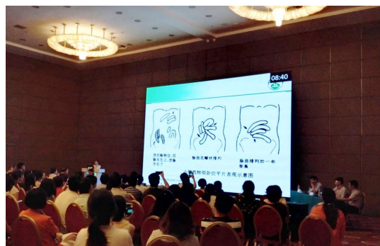
图 10 胃肠道急诊的影像学评价(赵丽琴).