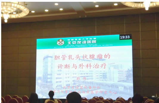
图 12 胆管乳头状腺瘤的诊断与外科治疗(郭伟).