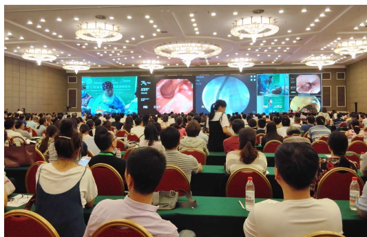
图 3 操作专家内镜诊治的演示。