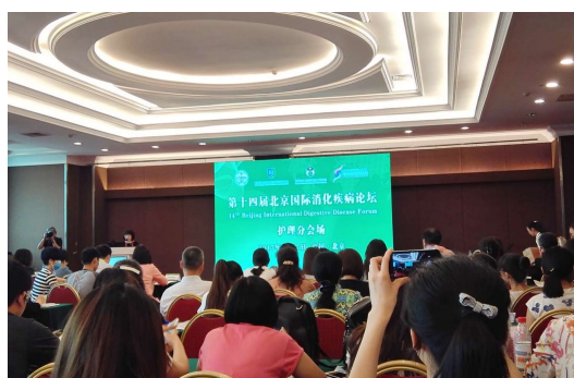
图 7 护理分会场。