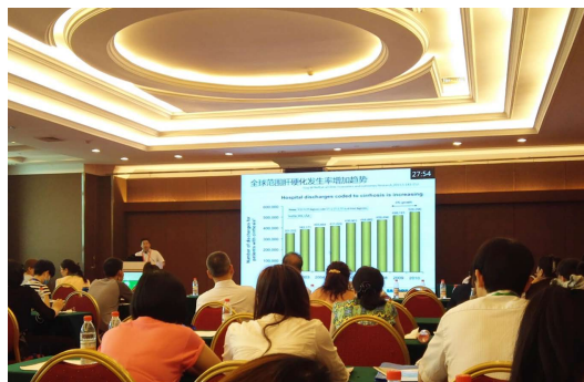
图 6 麻醉分会场。