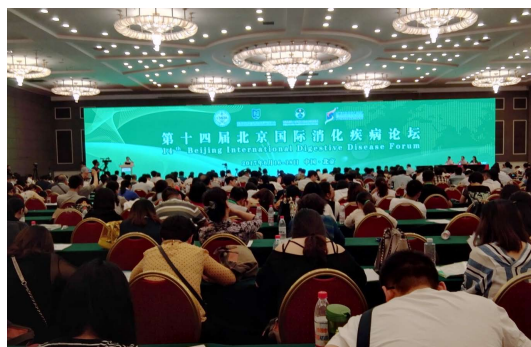
图2 第十四届北京国际消化疾病论坛现场,会议大厅座无虚席。

会副秘书长袁亚明教授,北京友谊医院党委书记、理事长辛有清教授,亚太消化疾病学术周联盟主席、新加坡樟宜综合医院Fock Kwong Ming教授,世界消化内镜学会主席Jean-Francois Rey教授和世界著名消化内镜专家、ERCP先驱、美国南卡罗来纳医科大学Peter Cotton教授先后在开幕式上致辞 [1] 。据介绍,本次会议继续秉承前十三次大会的精神,将消化、消化内镜、肝病、普外科、影像、病理及护理相结合,现场直播消化内镜和腔镜手术的演示,还将开展多个特色专题论坛。通过阅读会议日程册,了解到此次会议分为胃肠肝胆内外科联和论坛、临床研究及大数据质量管理分会场、遗传代谢分会场、麻醉分会场、护理分会场、胃肠道影像诊断分会场、消化系早癌分会场和著名国际会议快讯等多个专题研讨会。30 min的开幕式后,多功能大厅和三个会议室齐头并进,同时展开各个专题的讲座。我决定有选择性的来聆听各大大专题讲座。首先,在多功能大厅观看了操作专家内镜诊治的演示(图3),娴熟的操作技术,严谨、不急不躁的