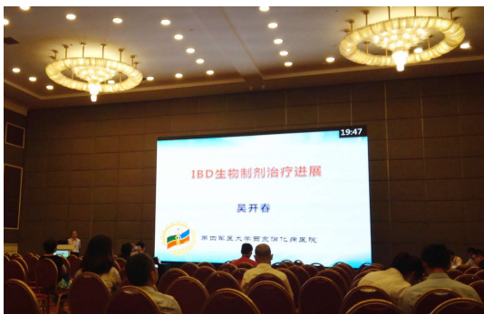
图 11 炎症性肠病生物制剂治疗进展(吴开春).