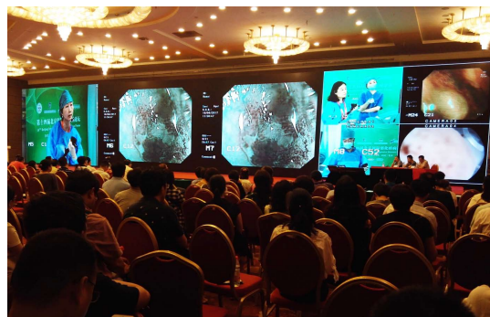
图 9 操作专家内镜诊治的演示.