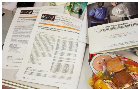
图 8 某企业使用World Journal of Gastroenterology已发表的两篇相关性稿件进行推广。